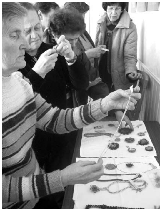
Neįgalųjų pagamintų rankdarbių kaskart galima įsigyti vykstančiose mugėse.