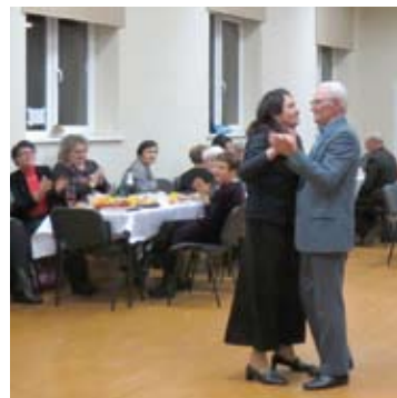
Kavarskiečiai romansų klausė susėdę prie stalų.