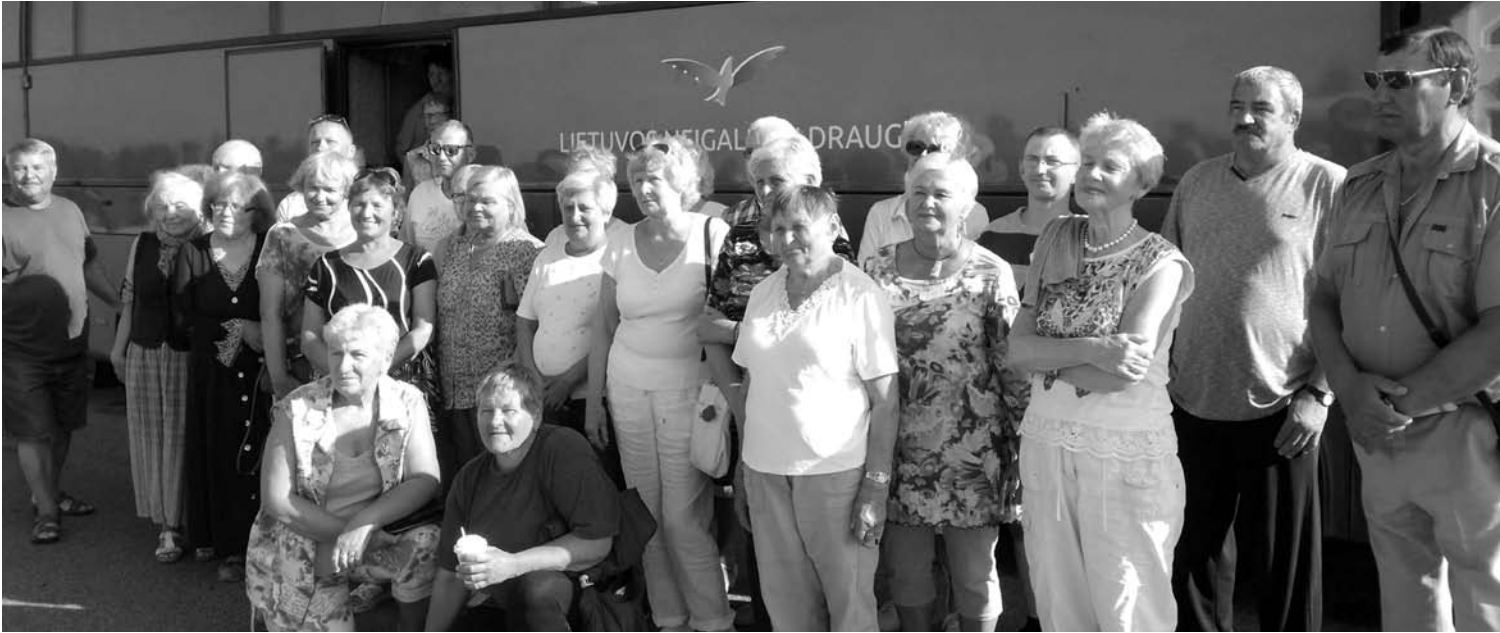
Anyškčių rajono neįgalųjų draugija vienija apie 800 anykštėnų.