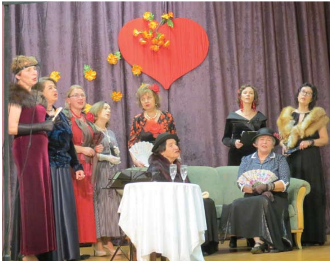
Ilgesingi romansai („Rožė“, „Tu kaip viešnia“, „Laiškas“ ir kt.) suvirpino kavarskiečių širdis.