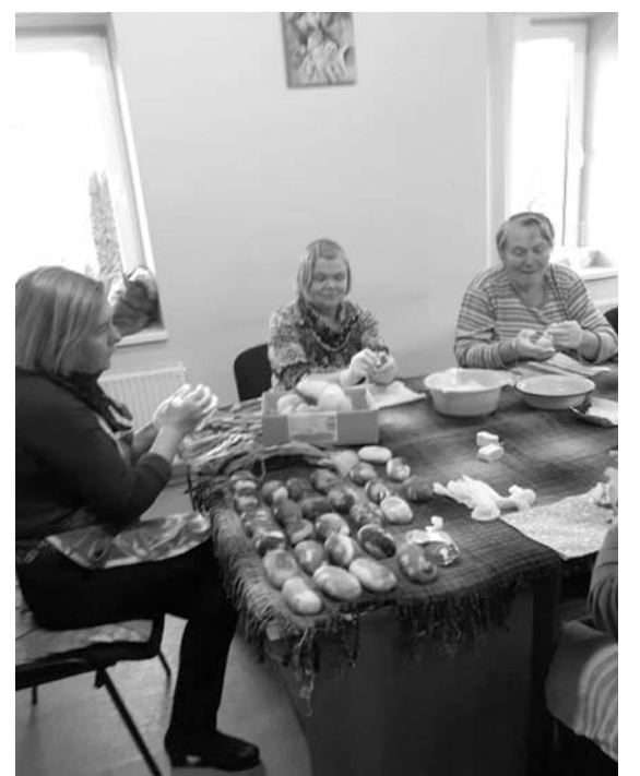
Neįgalieji mielai mokosi pačių įvairiausių amatų.